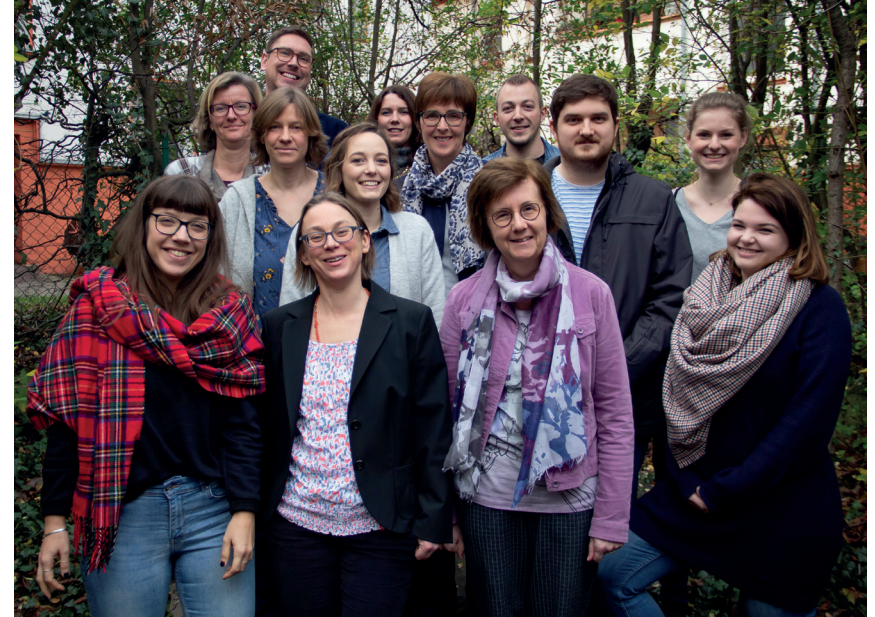
Das Team des Instituts für Niederlandistik 2019

Danke für Ihre Anwesenheit! Dank voor uw aanwezigheid!